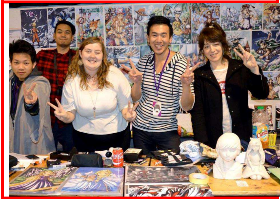
Japan Party 2016