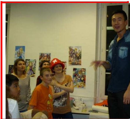
Quoi de mieux qu'une fête pour souder le groupe !