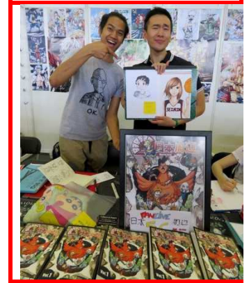
Japan Expo 2016