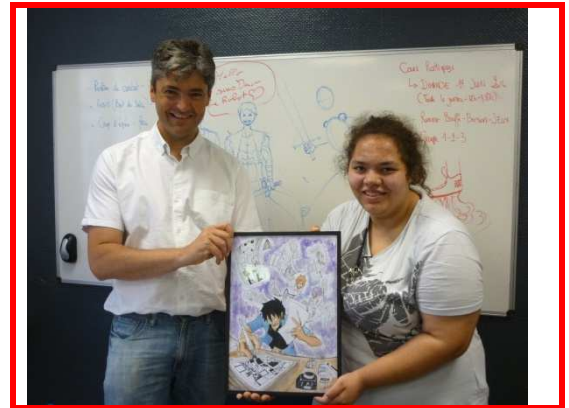
Remise du prix, par M. Jean-Baptiste Tournier