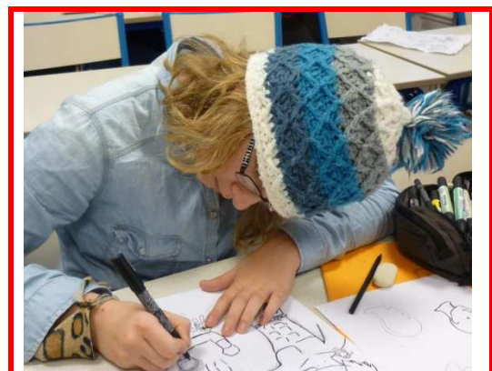
En plein travail... Chut !!