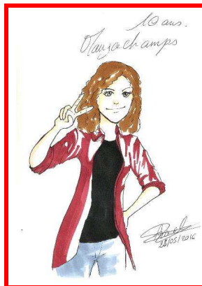
Portrait, par Roxane