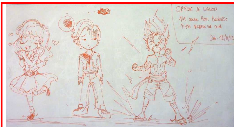
Appel aux personnes intéressées pour un prochain festival