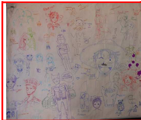
La fresque collaborative.