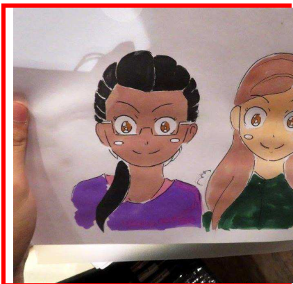
Portrait, par Ernest