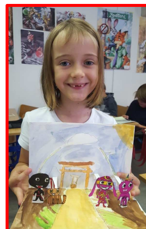
La joie de présenter sa réalisation !