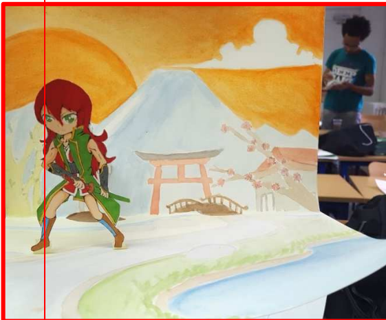
Une femme en action