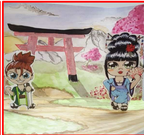
Un peu d'humour