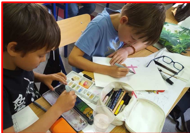
Les frères en action ^^