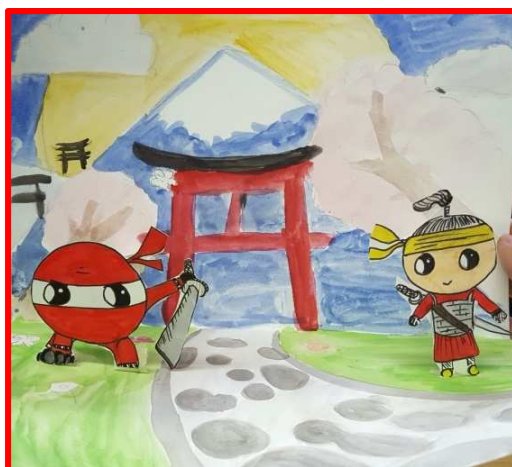
Les ninjas ^^